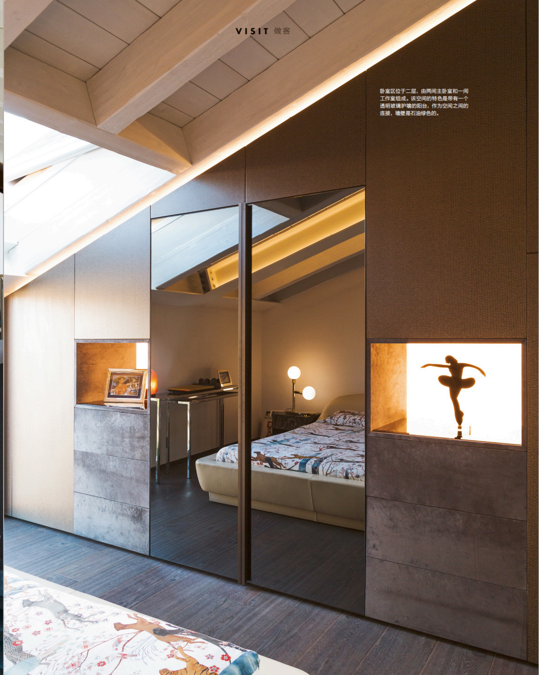
卧室区位于二层，由两间主卧室和一间工作室组成。该空间的特色是带有一个透明玻璃护墙的阳台，作为空间之间的连接，墙壁是石油绿色的。