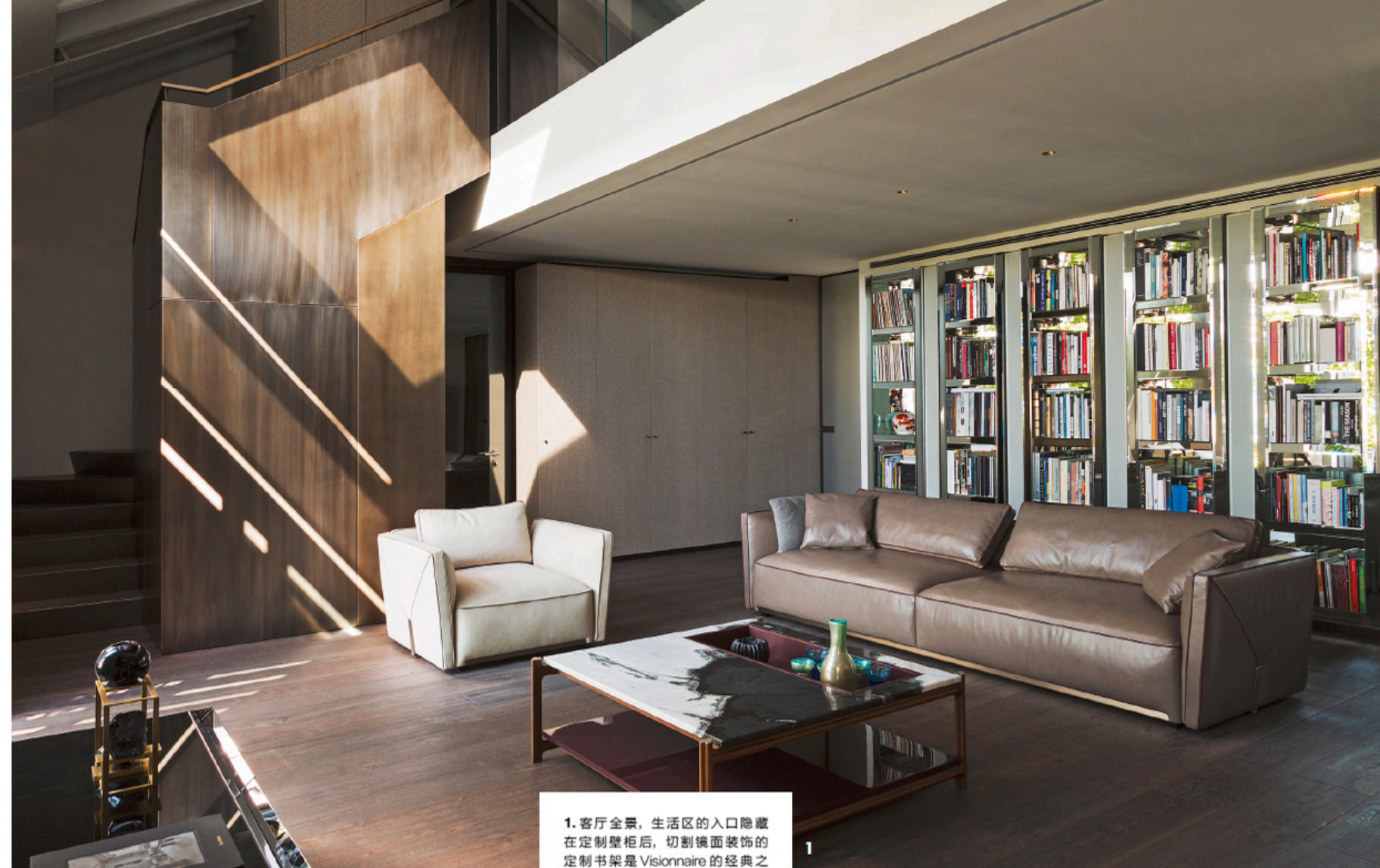
1. 客厅全景，生活区的入口隐藏在定制壁柜后，切割镜面装饰的定制书架是 Visionnaire 的经典之作。Mauro Lipparini 设计的旧灰色 Bestian 沙发和沙发椅，以及低矮的 King's Cross 茶几，都来自 Visionnaire。2. 厨房，采用金属漆面橱柜，磨砂玻璃和 Grigio Alpi 石材，Fabula 系列的玻璃瓶由 Marta Giarini 设计。3. 由生活区延伸出的绿色花园温室拥有可调节空间的技术屋顶，攀缘植物增强了私密性和自然感。对页：4. 夫妇俩收藏的艺术画作。5. 有着暗夜风格的盥洗室，表面采用了 Alimonti 的火山石与自然主题的手绘瓷砖，铝鳞片的吊顶来自 Galahad。